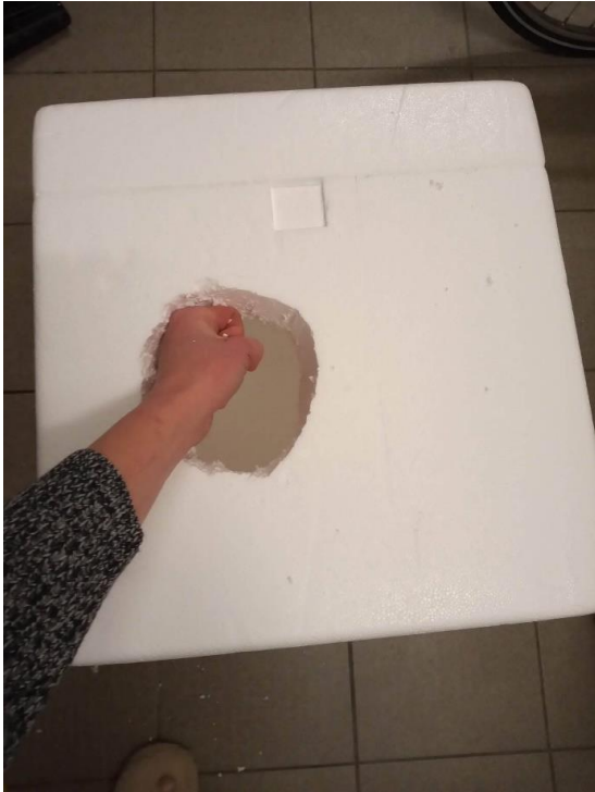
3. Zak erom (240 L), overtollige wegknippen